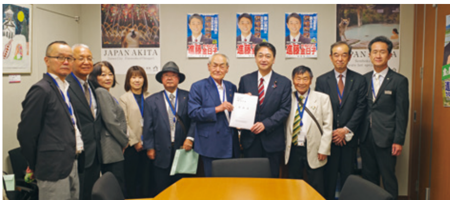
進藤金日子 参議院議員