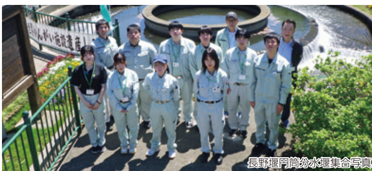
長野堰円筒分水堰集合写真