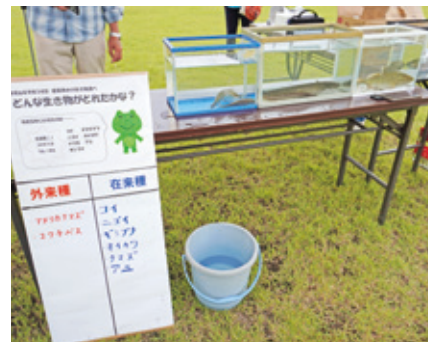
生き物調べの結果