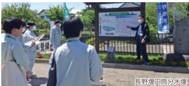
長野堰円筒分水堰

それぞれの管理者に説明をしていただき、土地改良区の施設や事業の内容のみならず、歴史や背景、特徴も学ぶことができ、非常に有意義な研修となりました。