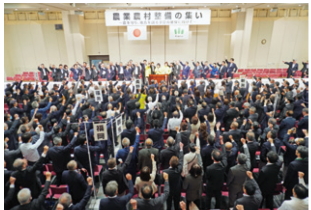
ガンバロウ三唱 会場の様子