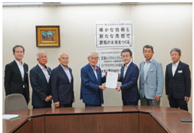
宮前県土整備部長へ要望書の手渡し