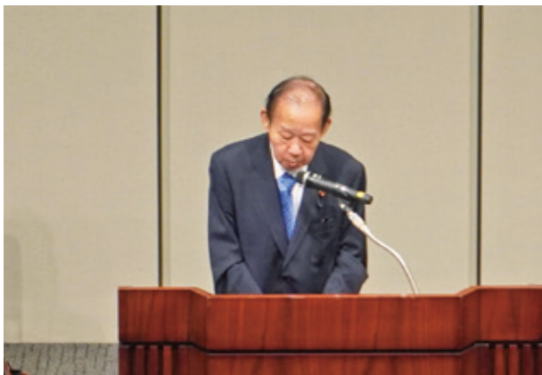
主催者挨拶 全国水土里ネット 二階会長