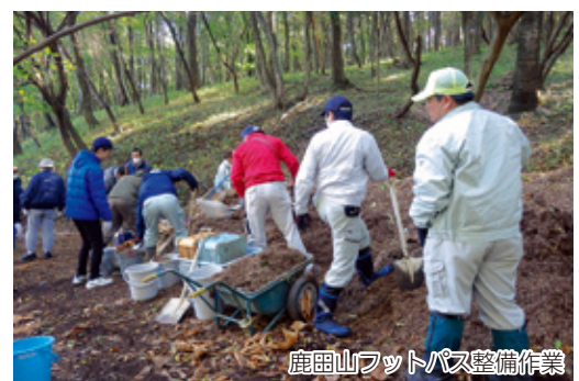
鹿田山フットパス整備作業