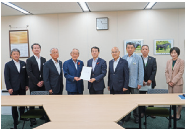
砂盃農政部長へ要望書の手渡し