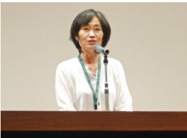
開会挨拶 群馬県農村整備課 塩谷水利保全対策主監