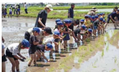
幼稚園・保育園児の田植えの様子