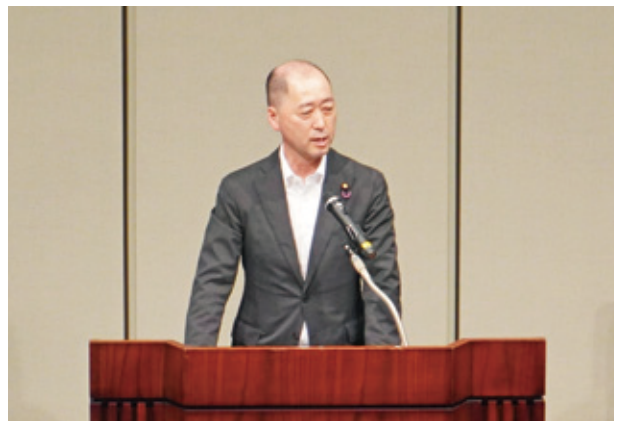
情勢報告 全国水土里ネット 宮崎会長会議顧問