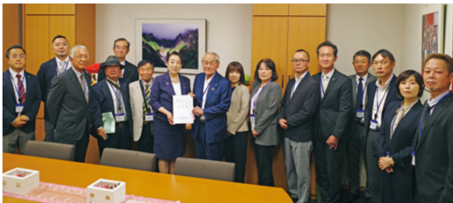
尾身朝子 衆議院議員