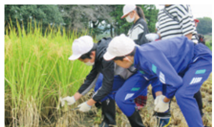
小学生の稲刈りの様子