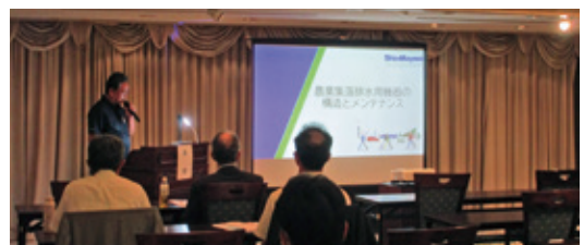
講演会 新明和工業 田中様