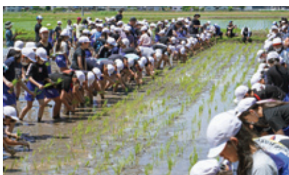
小学生の田植えの様子

その後、子供達が6月に植えた苗は、大きく立派な稲に成長し、9月30日(月)に稲刈りが行われました。たわわに実った稲穂を子供達が鎌を使って1つ1つ刈り取りました。