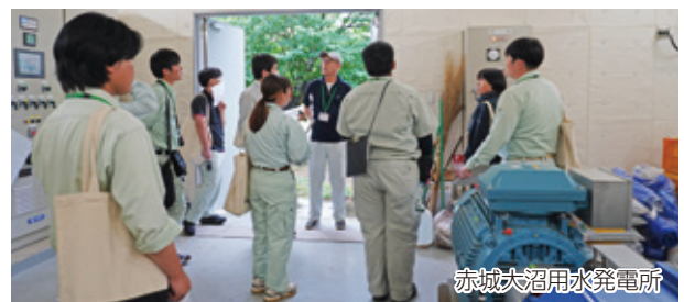
赤城大沼用水発電所