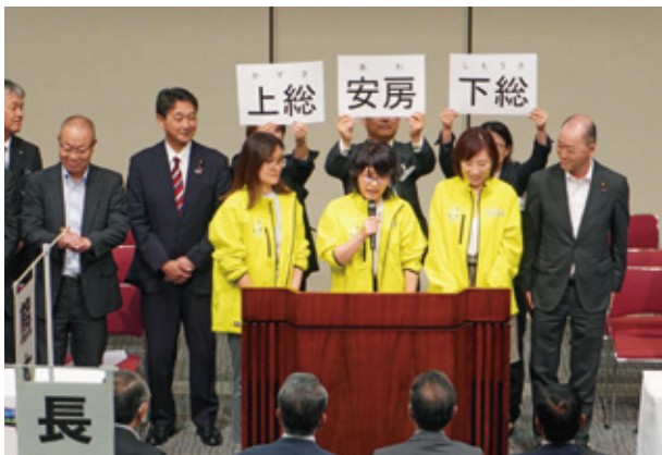
ガンバロウ三唱 ちば水土里ネット女性の会