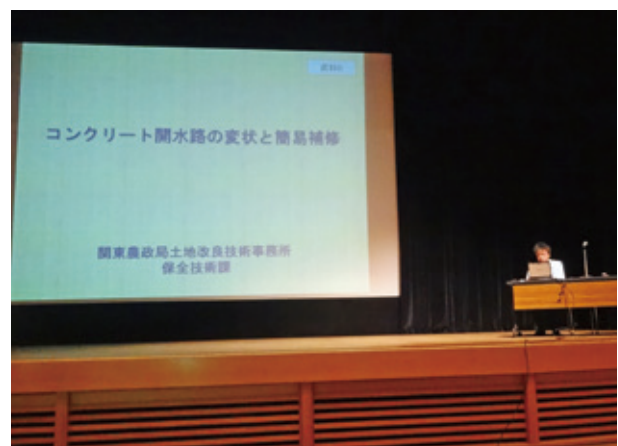
コンクリート開水路の変状と簡易補修 関東農政局土地改良技術事務所 保全技術課 中嶋課長